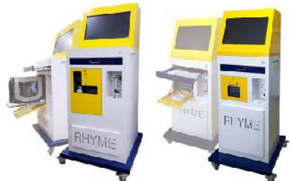
<MES 시스템 및 자체 H/W(KIOSK/관제 모니터 등)>