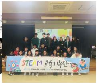
<교육 SW개발 및 교육서비스>